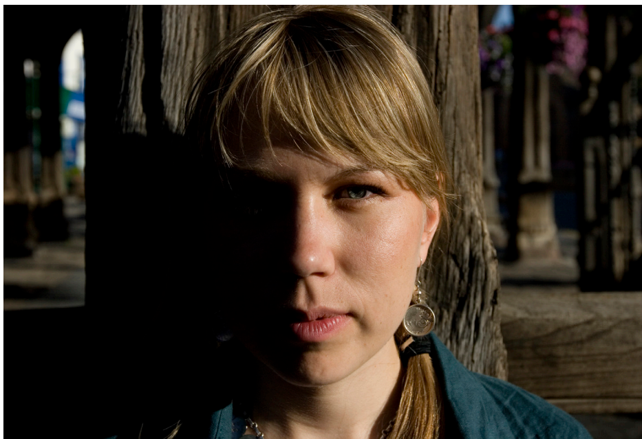
võimsad tüübid ja

jne. Ta oli muide ka kõva koguja, temast jäi pärast surma järele terve keldritäis moose, kompotte, mahlu ja muid hoidiseid. Väga suhtlev ja avatud tüüp, seltskonna hing. Vanaema soovastu oli sissepoolsem, igatsem tüüp, kes mängis vahel kodus klaverit, luges vanu armastuskirju, temas oli millegi teostumatu igatsus sees... Ja ma tunnen, et need kaks poolust on minul ka täpselt samamoodi sees. Ka mu oma vanemad on